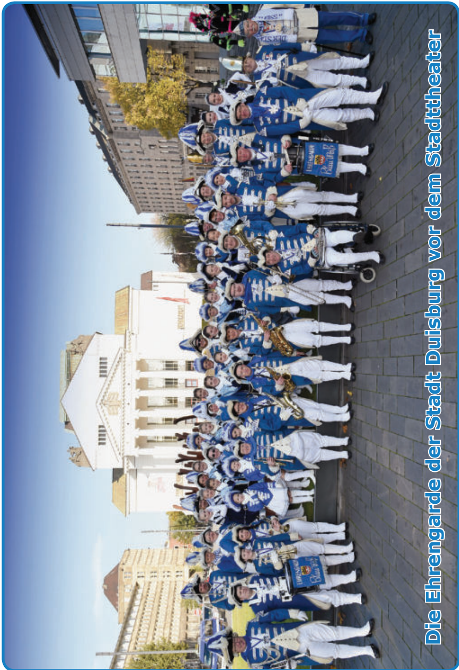
Die Ehrengarde der Stadt Duisburg vor dem Stadttheater