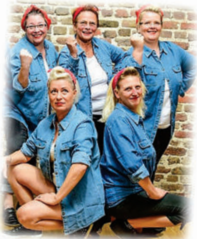
Show-Tanztruppe „Blue Sisters“