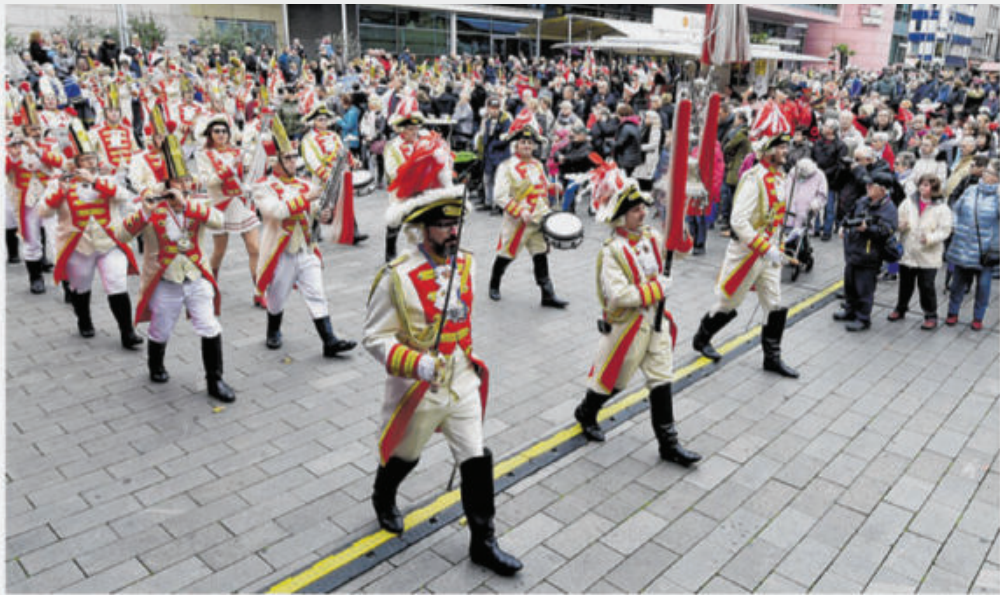
Mit klingendem Spiel marschierten die Karnevalisten auf dem König-Heinrich-Platz auf.