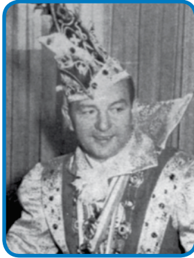
1958 Prinz Karl II.