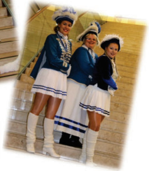
Unsere Trainerinnen / Gardeleitung