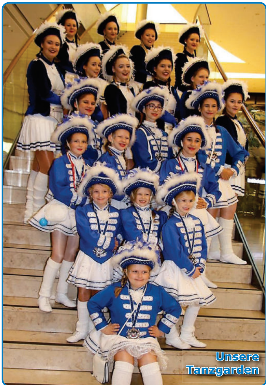
Ehrengarde der Stadt Duisburg Blau-Weiß 1929 e. V.