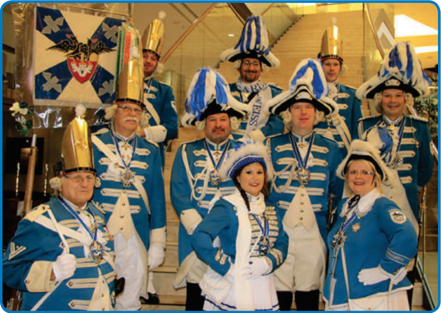
Geschäftsführender und erweiterter Vorstand, sowie Standartenträger.