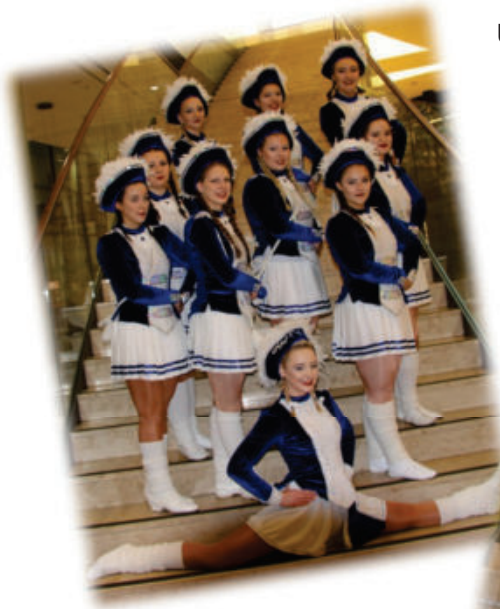
Unsere „New United Motions“